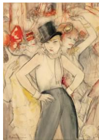
Jeanne Mammen Sie repräsentiert (Faschingszene) , um 1928