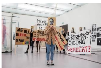
Dokumentation Route68, Foto: Karin Wabro

Im Herbst 2018 entwickelten Lehrlinge des Magistrat Linz in einer Projektwoche eigene Fragestellungen zum Thema 1968. Dabei ging es neben dem Erforschen der Ausstellungen Wer war 1968? in den Museen der Stadt Linz vor allem darum, einen Freiraum für den eigenen Ausdruck der BerufsschülerInnen zu ermöglichen. Die Projektwoche mündete in eine künstlerische Fotodokumentation sowie einer Protest-Choreographie und wurde von den Kunstvermittlerinnen Dunja Schneider und Karin Wabro begleitet. Route 68 fand im Rahmen des Programms „Geschichte gemeinsam verhandeln“ als Beitrag zum Gedenk- und Erinnerungsjahr 2018 statt. Gefördert vom Bundeskanzleramt. Programmkoordination: KulturKontakt Austria (aus Mitteln des BMBWF).