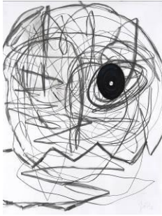
Otto Zitko, Ohne Titel , 2010