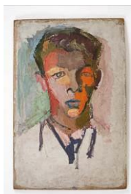
Maria Lassnig, Porträt Arnulf Rainer, 1948-1949