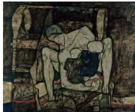
Egon Schiele, Blinde Mutter , 1914 Leopold Museum, Wien