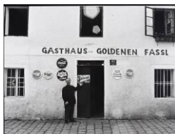
Maximilian Koller, Gasthaus in Alt-Urfahr , um 1980, LENTOS Kunstmuseum Linz