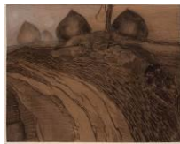
Paul Gauguin, Heuschober an einem Feldweg , 1888 NORDICO Stadtmuseum Linz