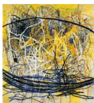
Otto Zitko, Ohne Titel , 2010 © Bildrecht Wien, 2018 LENTOS Kunstmuseum Linz