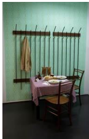
Wirtshaus Interieur