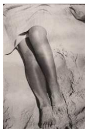
Herbert Bayer, Beine im Sand , 1928