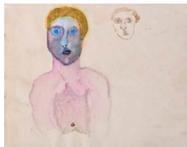
Heinrich L., Zeichenheft , undatiert, Sammlung Breitenau, ©StASH DJ 39/5427