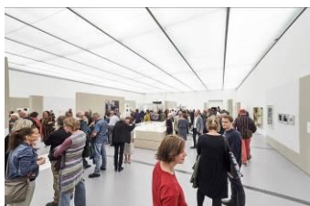
Ausstellungseröffnung Wer war 1968? , Foto: Sandro E. E. Zanzinger