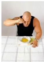
Linde Klement, Sinnlichkeit und Lust am Essen , 2004 NORDICO Stadtmuseum Linz