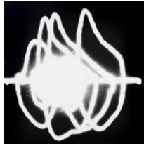
Otto Zitko, Spirogramm aus der Serie Inspiration , 1992

© Bildrecht Wien, 2018, Foto: Crisan, Wien