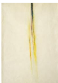
Arnulf Rainer, Ausgießung des heiligen Geistes , 1952