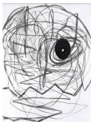
Otto Zitko, Ohne Titel , 2010 © Bildrecht Wien, 2018, Foto: Lisa Rastl