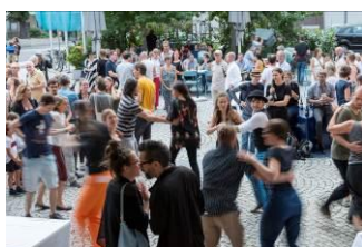
Sommerfest im NORDICO, Foto: Sandro E. E. Zanzinger

Das Sommerfest im Juli in gemütlicher Atmosphäre am Vorplatz des NORDICO Stadtmuseum hat sich mittlerweile als beliebter Fixpunkt in der Linzer Veranstaltungsszene etabliert. Im kommenden Jahr wird es im Rahmen der Ausstellung Prost, Mahlzeit! bereits zum dritten Mal in Folge stattfinden.