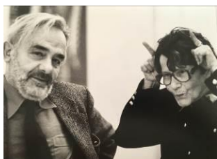
Maria Lassnig und Arnulf Rainer, 1999