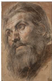
Peter Paul Rubens (Werkstatt), Kopfstudie eines bärtigen Mannes , o. D.