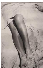
Herbert Bayer, Beine im Sand, 1928