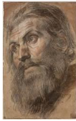
Peter Paul Rubens (Werkstatt), Kopfstudie eines bärtigen Mannes , o. D. NORDICO Stadtmuseum Linz